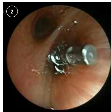
Bronchoscopie waarop het bitje te zien is in de bronchus intermedius.