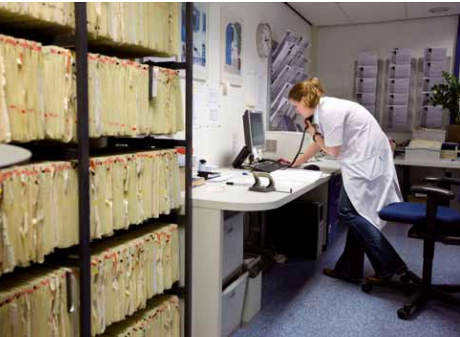
Tussendoor is er telefonisch overleg over een patiënt van de dagopname.